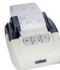
Stampante RS 232