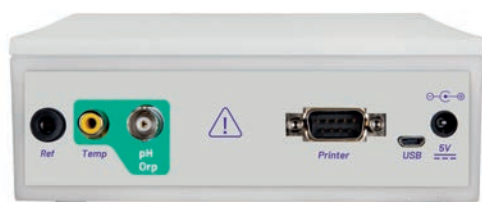
Pannello posteriore pH 60 VioLab