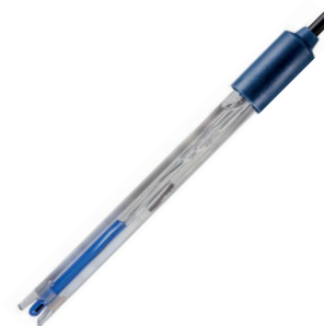
201 T DHS