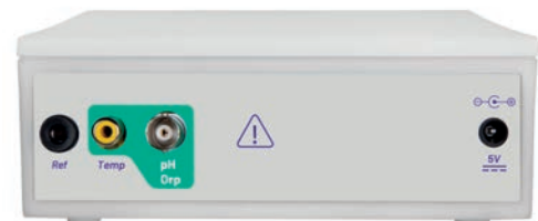
Pannello posteriore pH 50 Violab

Il segnalatore LED permette di tenere sempre sotto controllo lo stato dello strumento.